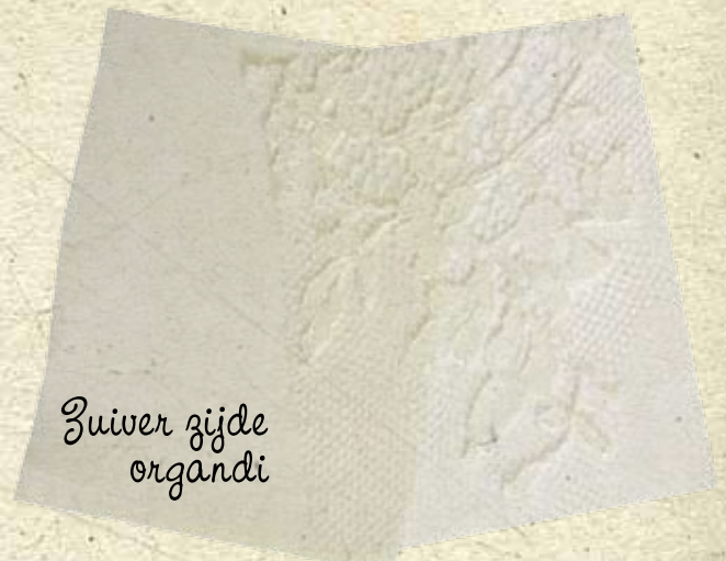
Zuiver zijde organdi